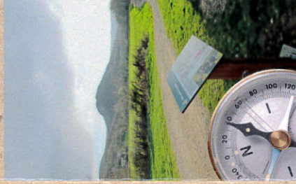
Sentier d'Intérêt Départemental géré par le département du Tarn.