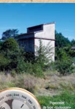
Pigeonnier de type «toulousain»